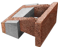
Bloc pour pente