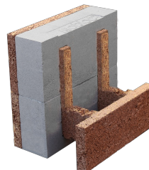
Bloc de rive