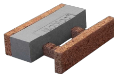
Bloc de réhausse