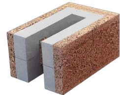
Bloc de bordure