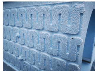
Schéma des rails