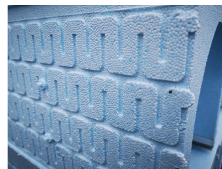
Schéma des rails